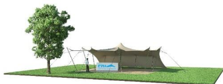
Montage deux côtés fermés au sol